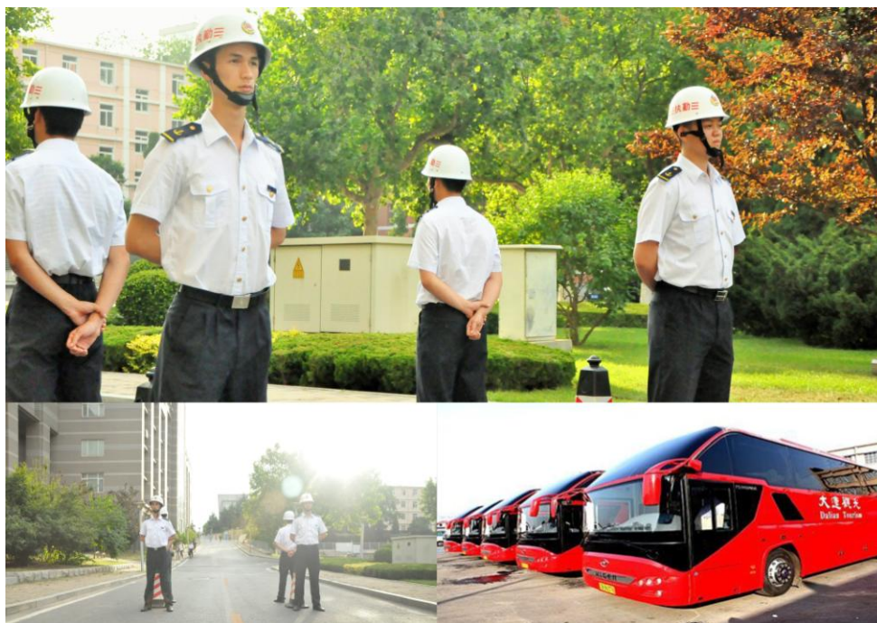
旅游大巴和执勤志愿者保证营员安全出行