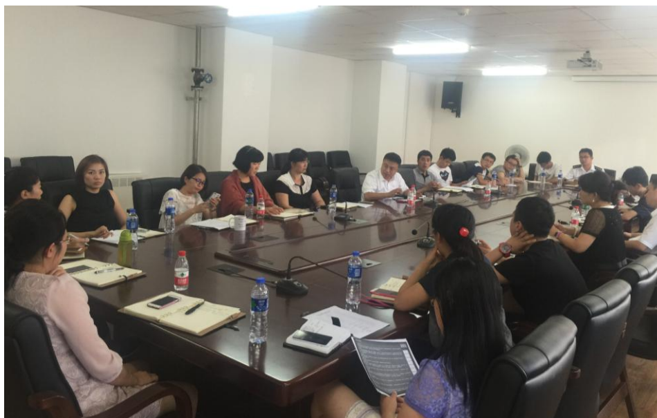
科学营工作组多次召开工作会议商讨安全准备工作

障 2015 年青少年高校科学营大连海事大学分营的各项活动顺利进行，强化营员的安全意识，确保营员的人身和财产等安全，按照中科院、省科协的相关要求和部署，学校制定了全方位的安全保障措施。