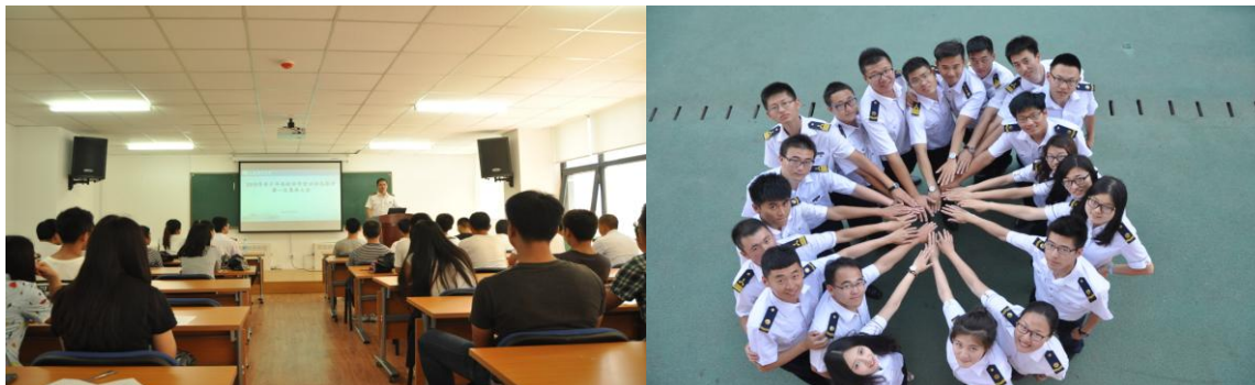
志愿者们参加科学营专项活动培训及随队志愿者风采

接待礼仪、安全措施、应急办法等方面专业规范的培训，并着重针对活动过程中的安全注意事项和服务细节等进行了重点培训。每次活动之前都统一集合点名，全力保障人员安全。